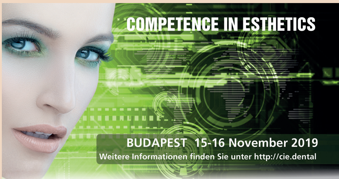
Competence in Esthetics Symposium, das Highlight für Zahnärzte und Zahntechniker in der Region.