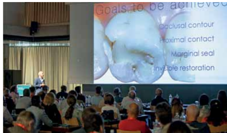
Auf grosses Interesse traf bereits der erste DENTAL INNOVATION CONGRESS® im vergangenen August.

Restorationen und einem weiteren Vortrag aus der Schweiz zur Endodontologie mit dem Thema «Guided Endo». Am Nachmittag folgen dann die vorher erwähnten